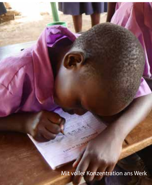
Mit voller Konzentration ans Werk