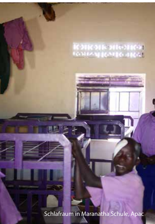
Schlafräum in Maranatha Schule, Apac