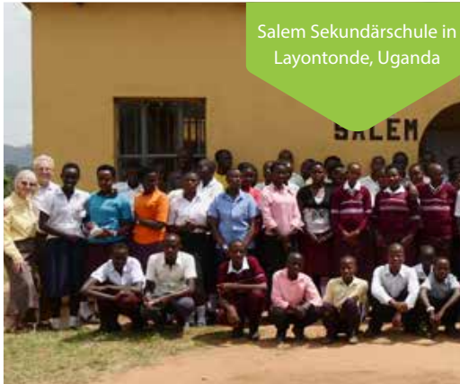
Salem Sekundärschule in Layontonde, Uganda